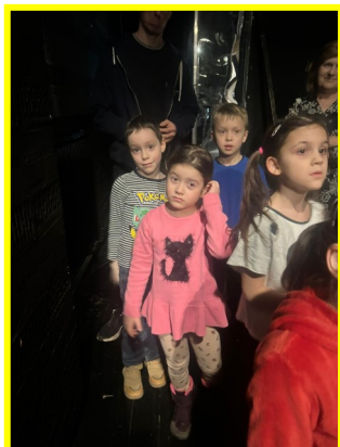
Foto relacje ze zwiedzania teatru od kulis