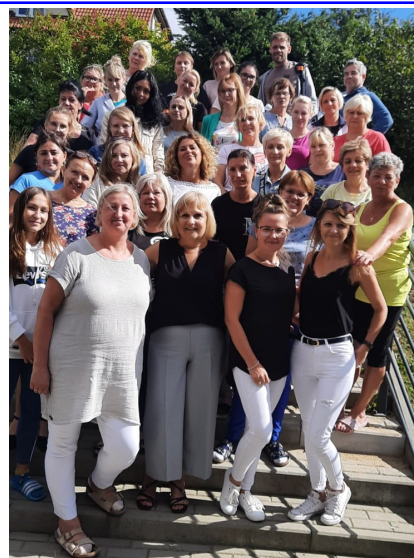
Pracownicy Przedszkola nr 82 w Gdańsku